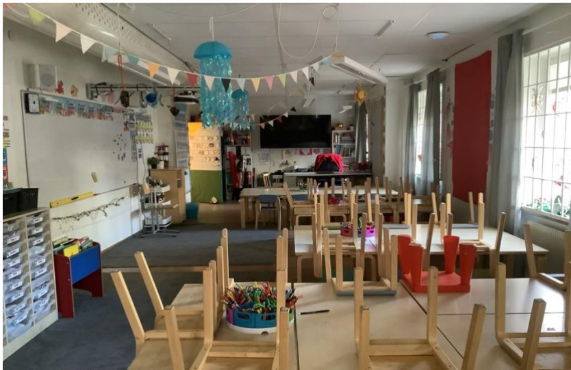
Klassenraum der Vorschulklasse